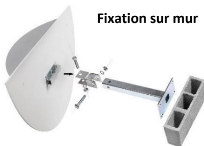
Fixation sur mur

Incluse avec le miroir. Elle permet la pose sur tous les poteaux de 60 à 90 mm de section ou directement sur le mur.