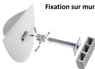
Fixation sur mur

Incluse avec le miroir. Elle permet la pose sur tous les poteaux de 60 à 90 mm de section ou directement sur le mur.